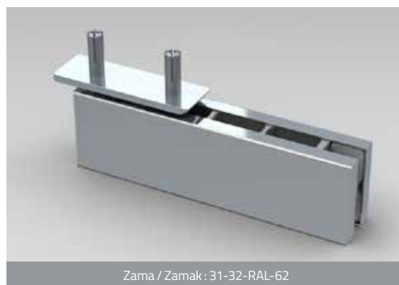
Zama / Zamak : 31-32-RAL-62

i DA ABBINARE SOLO A SERRATURE MAGNETICHE • SOLO SE PUEDE COMBINAR CON CERRADURAS MAGNÉTICAS • TO BE COMBINED WITH MAGNETIC LOCKS ONLY • KANN NUR MIT MAGNETSCHLÖSSERN KOMBINIERT WERDEN • COMBINABLE UNIQUEMENT AVEC DES SERRURES MAGNÉTIQUES